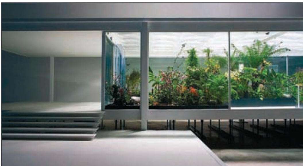
Obra ¿Estás seguro de verdad que el suelo no puede ser también el techo? , de Bik Van der Pol, un homenaje a la casa Farnsworth del arquitecto Mies Van der Rohe.