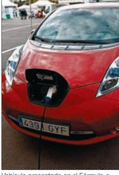
Vehículo presentado en el Fórmula-e.

Por ello, el CETIB, que cada año focaliza la atención en un sector de actividad específico, ha decidido dedicar el año 2011 a la movilidad sostenible, para impulsar la implantación de los vehículos eléctricos, buscar soluciones para arrebatar las dificultades