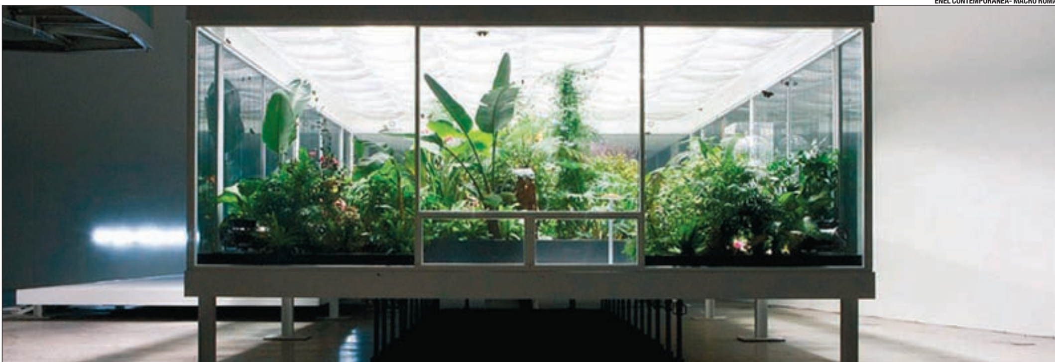
ENEL CONTEMPORANEA- MACRO ROMA

La recarga de los coches debería efectuarse en los momentos de menor demanda energética