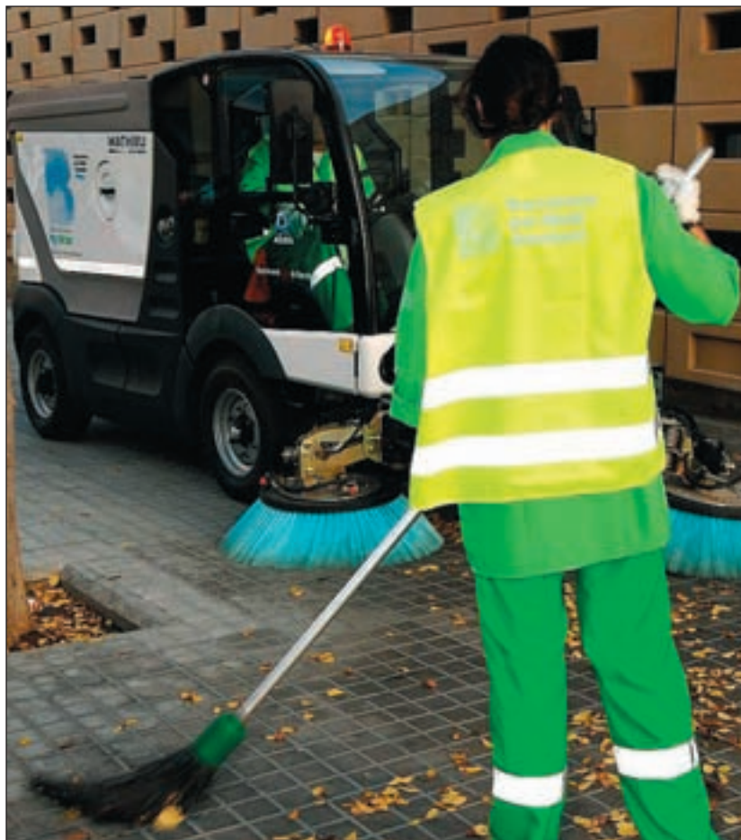
Brigada de limpieza en una calle de Barcelona.

larmente tienen lugar para limpiar las calles de la ciudad (barrido, baldeo, etcétera) siguen un programa municipal ajustado a las características de cada vía, en función de la densidad de usos ciudadanos que tiene, el tráfico o la tipología del tejido urbano.